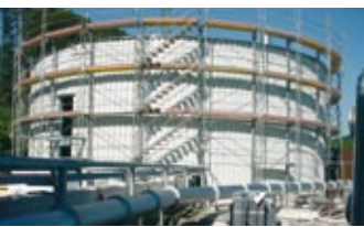
ARA Bern Neue Biologie/ Neue Schlamm-trocknung