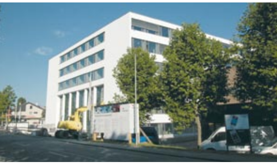
Laborgebäude Actelion Allschwil