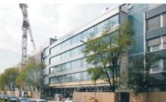
Sanierung Bürogebäude UBS Flurhof Zürich