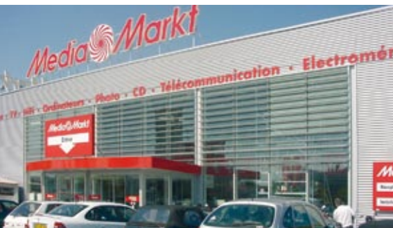
Media Markt Basel, Dietikon, Muri, Oftringen