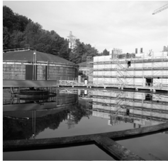
Mitten im ARA-Gelände ist das neue Biostyr-Gebäude entstanden.

Berater AG den Zuschlag. Diese offerierte das Biostyr-Verfahren, bestehend aus 16 Biofilterzellen, in denen Bakterien auf kleinen Styroporkügelchen den Abbau der Schmutzstoffe besorgen und gleichzeitig das Wasser filtern. Der nachgeschaltete Actiflo-Filter dient der Schlammwasserbehandlung. Trotz wesentlich besserer Reinigungsleistung ist die neue Anlage kaum grösser als die bisherige. Die ARA Region Bern ist mit der gefundenen Lösung zufrieden, weil alle Ziele bei minimalen Restrisiken im vorgegebenen Termin- und Kostenrahmen erreicht werden.