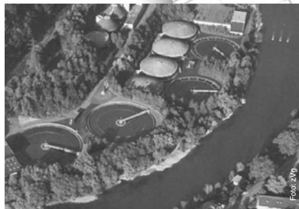
Die ARA Region Bern liegt eingebettet zwischen der Aare und der steilen Uferböschung.

Im Unterschied zu den übrigen drei Reinigungsstufen der Anlage entspricht die Leistungsfähigkeit der Biologie nicht mehr den gesetzlichen Vorschriften. Insbesondere die rund 20-jährigen Tropfkörper, in denen das Abwasser über eine Füllung aus Steinen verrieselt und von Bakterien gereinigt wird, müssen durch ein leistungsfähigeres Verfahren ersetzt werden. Bis Mitte 2004 wird die biologische Abwasserreinigung vollständig erneuert. In Zukunft soll der Stickstoff in eine besser verträgliche Form (Nitrat statt Ammonium) umgewandelt und teilweise eliminiert werden. Auch wird der Phosphorabbau zum Schutz des Bielersees gesteigert.