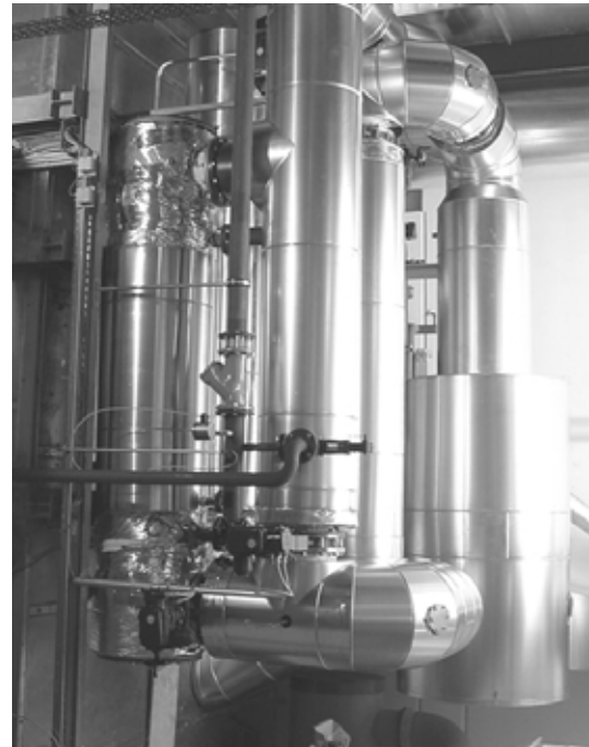
Hier fehlt noch der Bildtext: um was geht es im Foto?